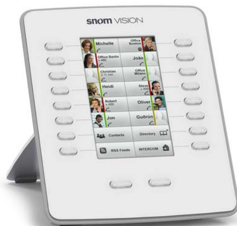
- SNOM Vision Expansion Panel (los verkrijgbaar) -